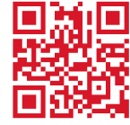
出展申込みフォーム